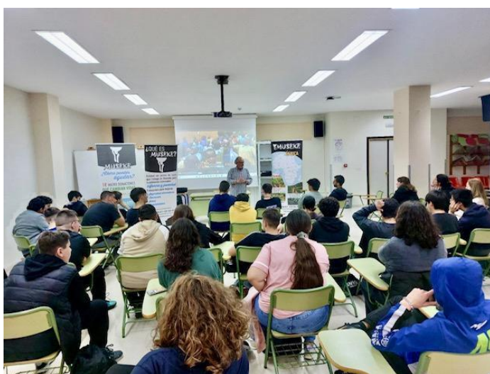
IES Rafael Alberti, de Cádiz.