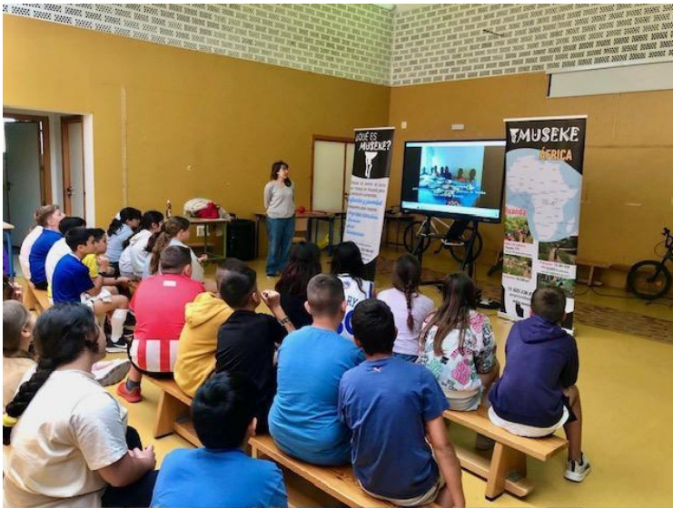
CEIP Padre José Casal Carrillo de San Fernando.