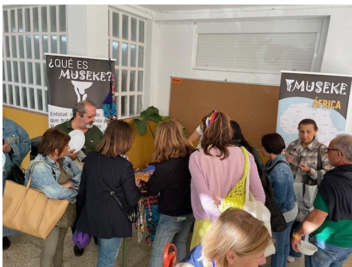
EOI de Cádiz.