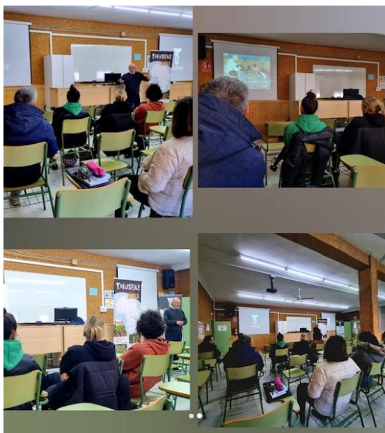
Instituto Provincial de Educación Permanente de Cádiz.