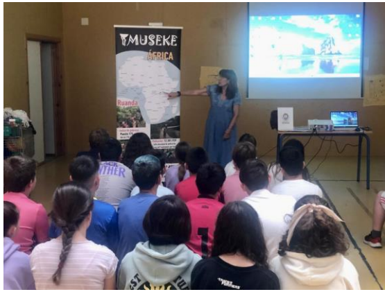
CEIP Padre José Casal Carrillo de San Fernando.