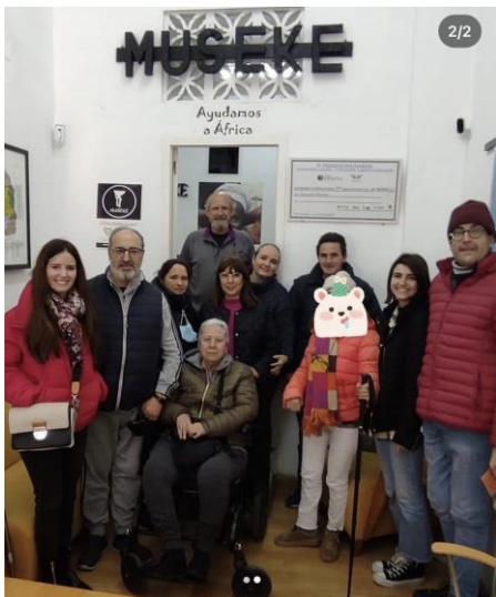
ADACCA, Asociación de Daño Cerebral Adquirido de Cádiz.