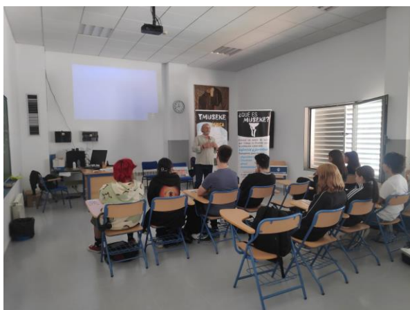
Escuela de Arte de Cádiz.