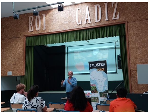
Escuela Oficial de Idiomas de Cádiz.